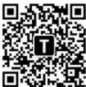
Figure 2: 扫码订阅“泰晓科技”公众号